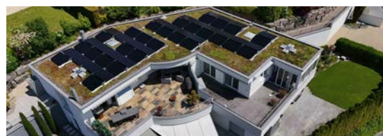
Bergstrasse 38 a-c

4,2 Mio. kWh Rückspeisung aller PV-Anlagen in unser Netz